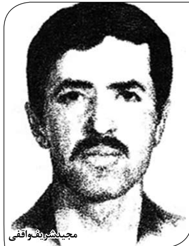
مجددشور و یقین‌آفرینی

کسانی که دست‌اندر کار فعالیت سیاسی و بخصوص کار تشکیلاتی هستند به خوبی معنای سیاسی - تشکیلاتی کلماتی مانند "فرد"، "گروه"،